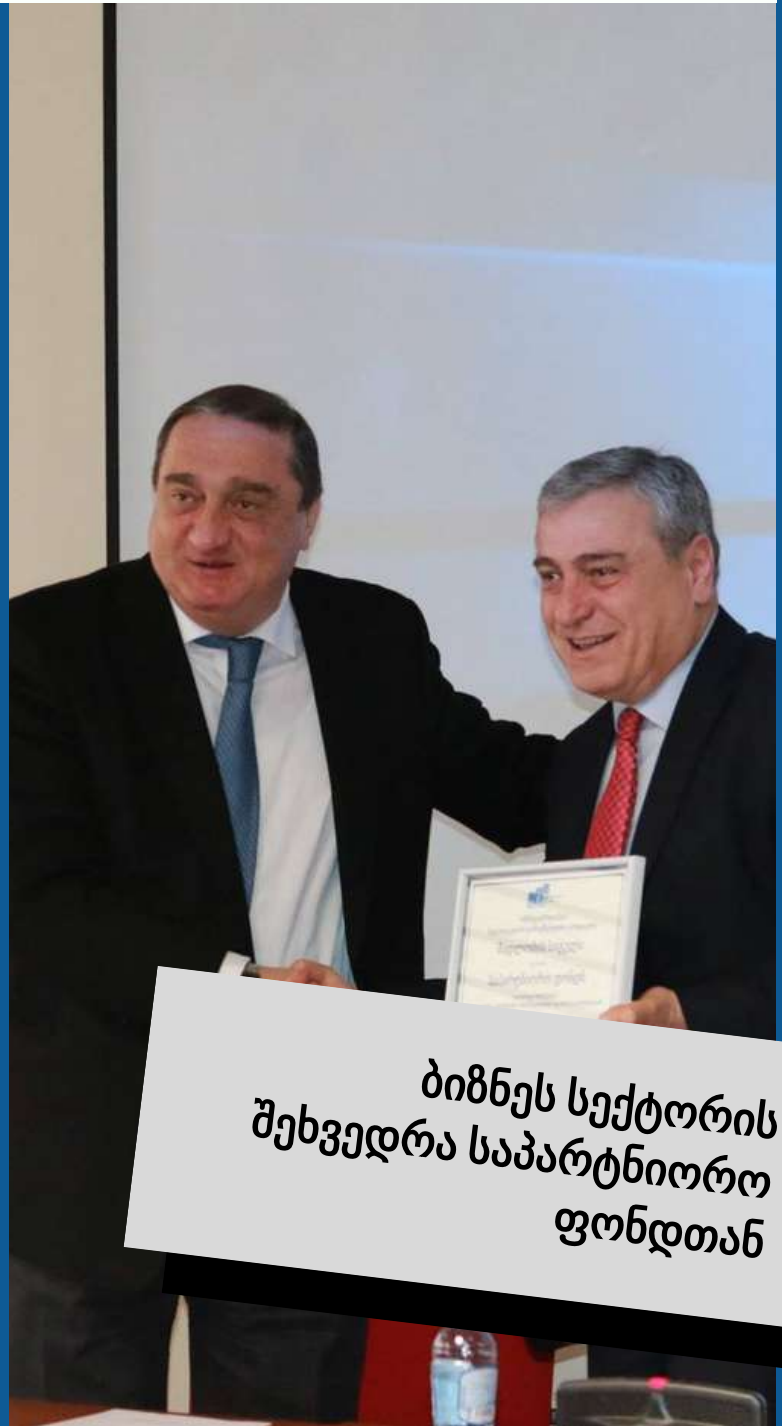
ბიზნეს სექტორის შეხვედრა საპარტნიორო ფონდთან