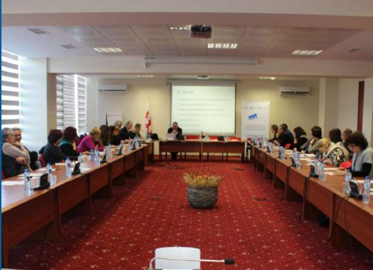
პროფესიული განათლების პროექტი - სემინარი