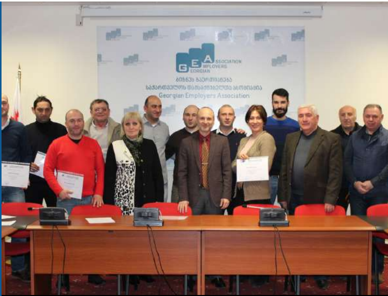
კორპორატიული ტრენინგი - რისკების შეფასება სამუშაო ადგილზე